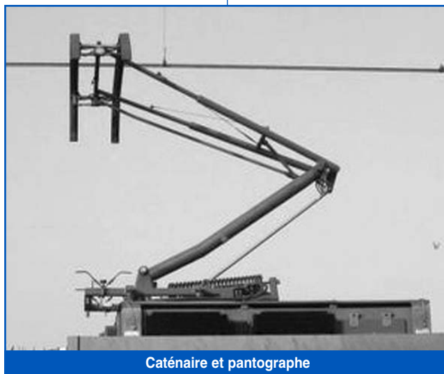
Caténaire et pantographe

- Egly/Arpajon : création ; début en 2014, achèvement mi 2016.